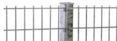
RANKO Profilschienenpfahl lt. GUVV